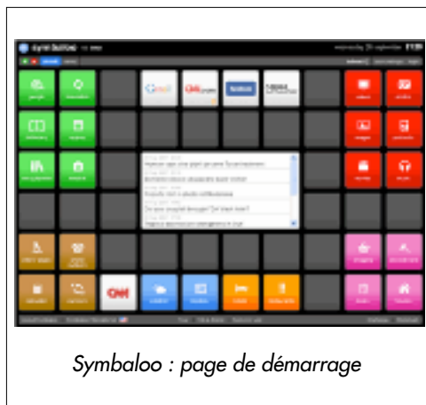
Symbaloo : page de démarrage